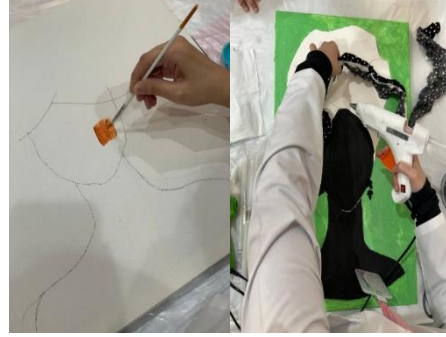
ورشة الفنون التشكيلية