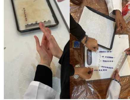
ورشة صناعة السبح