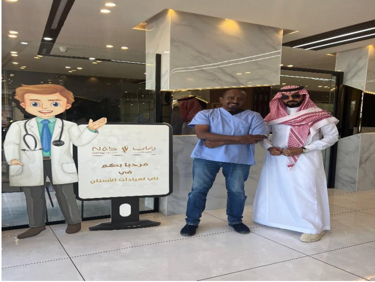
زيارة إدارة جمعية جنا لناب لعيادات الأسنان