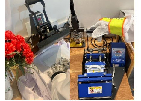
ورشة الطباعة الحرارية