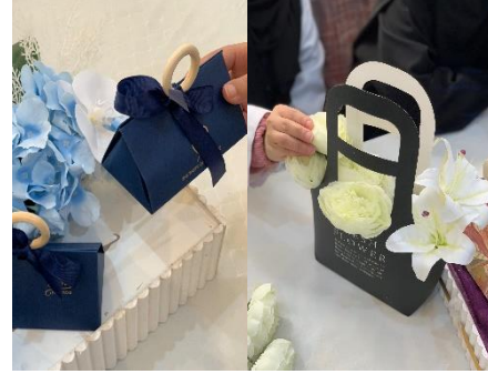
ورشة تنسيق الزهور وتغليف الهدايا